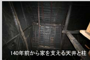
140年前から家を支える天井と柱