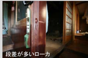
段差が多いローカ